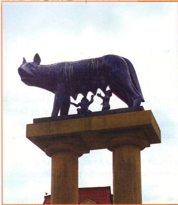
Lupa Capitolina, Constanța, România

Învăluite în legendă, începuturile Romei au constituit un element de mândrie, dar și un factor de coeziune pentru generații întregi de romani.