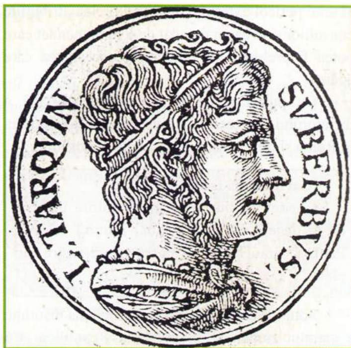
Tarquinius Superbus, al șaptelea rege al Romei, a domnit din 535 î.Hr. până la revolta romană din 509 î.Hr.

Astfel, prima categorie era constituită din cei doi consuli, care exercitau puterea supremă pe plan executiv. Urmau pretorii, cu atribuții, în principal, judecătorești, iar apoi censorii, singurii aleși pentru o perioadă de 5 ani, care aveau sarcini referitoare la bugetul statului. Alte categorii erau questorii, care se ocupau cu finanțele publice, și edilii cu rol în administrarea orașului.