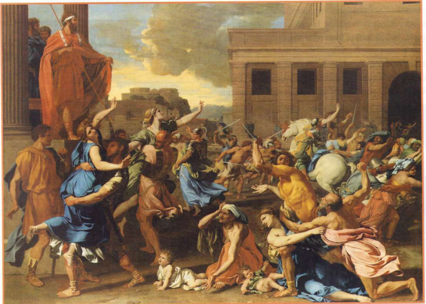
Răpirea sabinelor, de Nicolas Poussin, 1634–1635, ulei pe pânză, în Muzeul Metropolitan de Artă (New York City)

♦ Auguri – preoți care prevesteau viitorul după zborul, cântecul sau măruntaiele păsărilor.